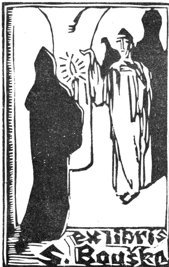
Josef Váchal: EXLIBRIS.

Vyryl, vytiskl a vydal ve 27 ex. Josef Váchal. V říjnu 1912. — Řeknete: Proč pouze 27 exemplářů? Malý příspěvek k dějinám českého umění. Umělec neměl více papíru! a ruční papír byl i tehdy drahý. 1. Sladkost hříchu. Eva blíží se ku keři, osypanému květem. Za ním fialový strom, obtížený jablky. Fialová, červená a žlutozelená. — 2. Pýcha. Na šedozelelé půdě jakési siamské božstvo. Postava muže, chromově žlutá; nohy jako drápy, v levici meč, okolo krku bílé drahokamy. Hlava jakoby kohoutím hřebenem zdobená, s ramen vlaje plášť hnědý, jako dlouhé vlasy větrem vlající. — 3. Lakomství. Rudá potvora s bílou, dokořán, v chrochtavém chechtotu, otevřenou tlamou, řičí rozkoší, válejí se v kupě zlatáček. Z nohou jen kolena