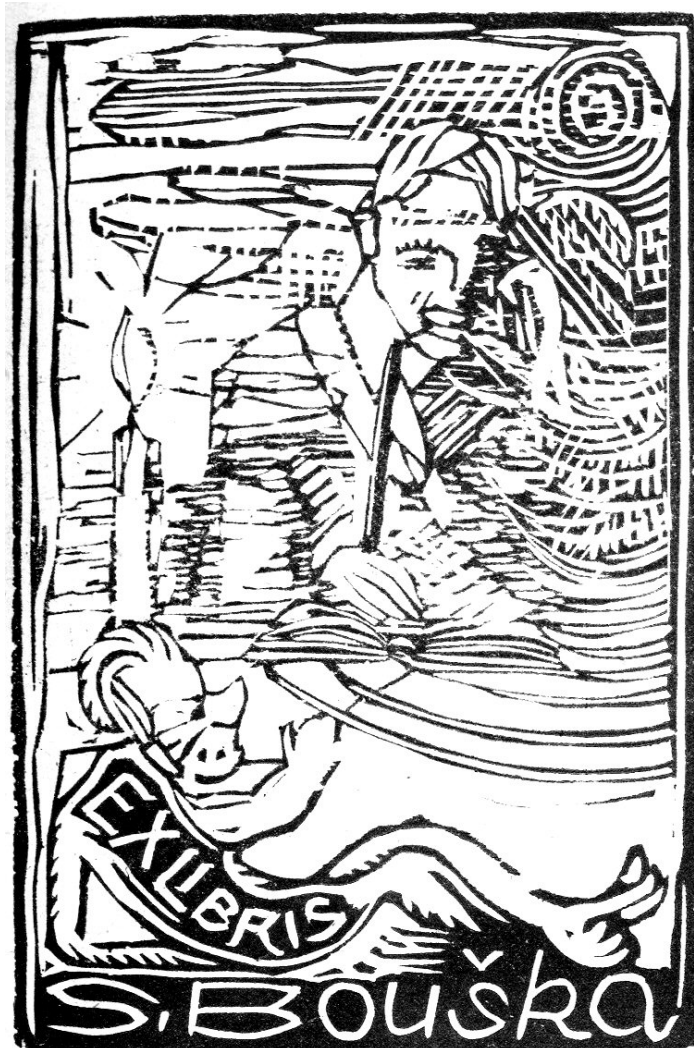
Josef Váchal: EXLIBRIS

kaktus bodlinatý. Pozadí bleděmodravé. 7. Závist . Řetězy uvázaná potvora s ocasem ještěřím rozpřáhá ruce jako chapadla po všem kolem. Oko nestvůrně bílé vylézá z hlavy. 8. Lenost . Ženský akt, hovicí si v trávě. Tělo žlutozelené. V pozadí keř s červenými květy. Psi a hadi, na