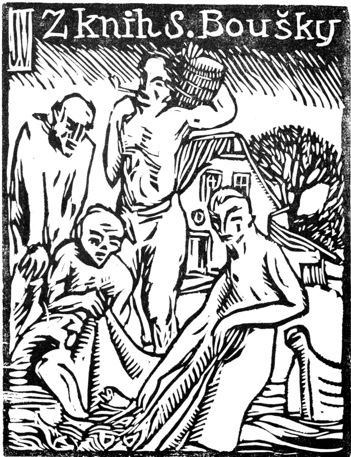
Josef Váchal: EX LIBRIS: RYBÁŘI

Váchal tvoří lehce. Myšlenek hrne se mu mnoho do hlavy a jsou to vždy myšlenky výtvarné, jež si již přinášejí svou formu budoucí. Načrtne lehce perem konturu kompozice a hned počne pracovat rydlý. Rychle a neúnavně. Konturu tuší a perem nakreslenou a celou desku přetře modrým tónem, z něhož černá linie vyniká a již prohledá světlo dřeva pod živě se vrývající rydlý. Kresba počátečná byla jen pomůckou, vlastní práce umělecká tvoří se a formuje teprve dřevoryteckou prací tvůrčí. Z prvotní kresby nepoznali byste, netušili ještě, co vlastně z hladkého povrchu desky zbuje pro definitivní otisk. Dřevo samo pomáhá a mluví k Váchalovi. Nekonečné možnosti otevírají se pod hrotem rydla a mrtvému dřevu dostává se